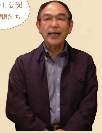
丹後語り部の会 (地球デザインスクール理事)