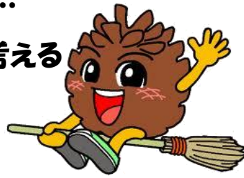
天橋立キャラクター 「あまぼっくり」